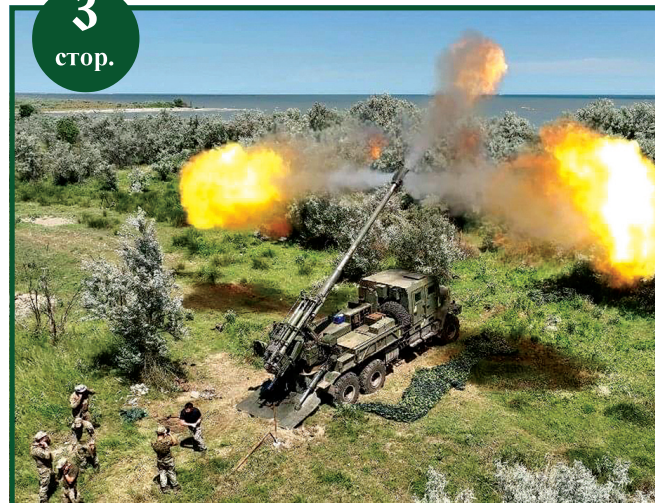
Залужний: Острів Зміїний звільнено від окупантів

Віктор Юзефович «ЮЗІК»: “ДЛЯ ПОСТРІЛУ ПО ЛІТАКУ ВИБІР ПОЗИЦІЇ ВАЖИТЬ ДУЖЕ БАГАТО”