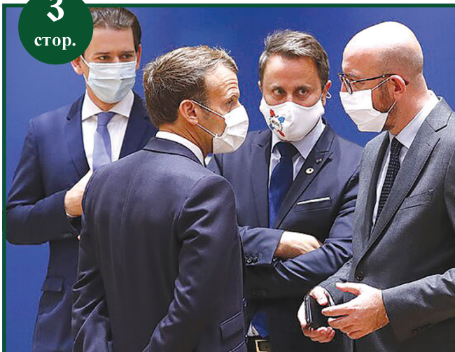
Україна стала кандидатом на членство у ЄС