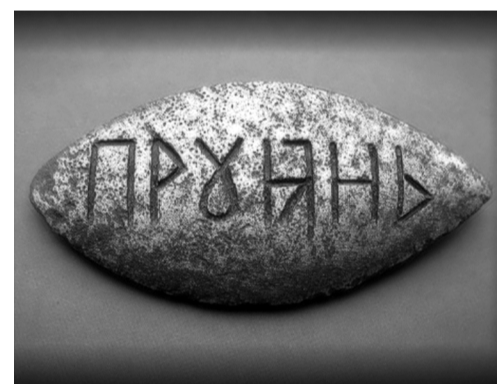
АРТАНСЬКА ПЛАСТИНА I ТИС. ДО Н.Е. З ВЕЛЕСОВИЧНИМ НАПИСОМ ПРОЯНЬ