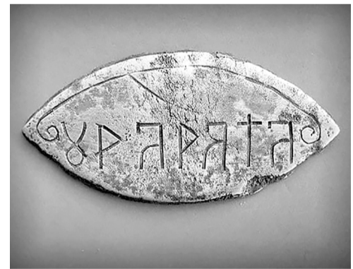
АРТАНСЬКА ПЛАСТИНА I ТИС. ДО Н.Е. З ВЕЛЕСОВИЧНИМ НАПИСОМ ОРАРАТА