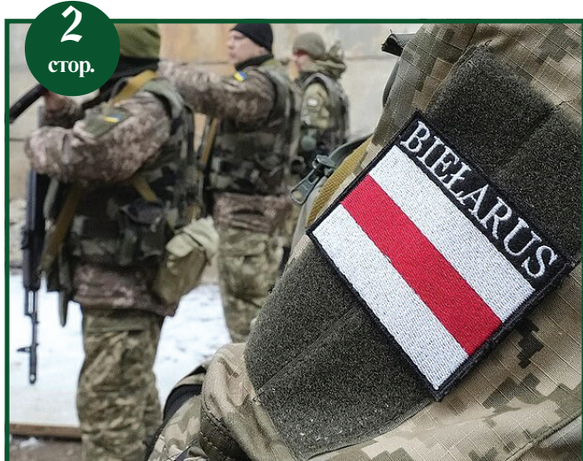
Перемога України – це зцілення Білорусі