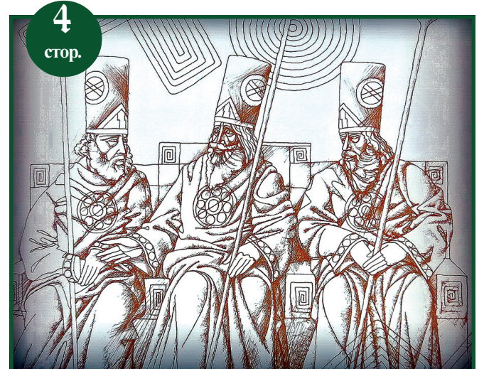
Якою була слов'янська держава тисячу років тому?