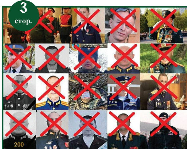
Скільки російських генералів приймуть українські чорноземи?