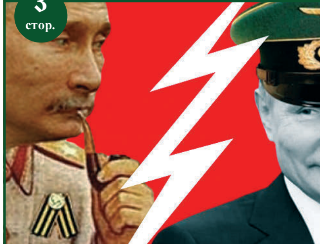
Звір із безодні мусить згинути в Україні