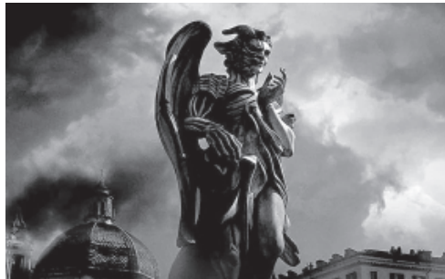
ДЕМОНІЧНЕ ЗЛО МАСКУЄТЬСЯ ПІД СВІТЛЕ І ПРАВЕДНЕ, БО Є ОМАНЛИВИМ І БРЕХЛИВИМ

усіма Брамами наявними у Світлому Ірії, щоб унеможливити потрапляння вірусного та темного в Праву.