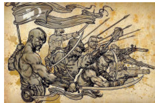
ДУХОВНО ОЗБРОЄНІ ТА РІШУЧІ У БОРНІ ЗАВЖДИ ОТРИМАЮТЬ ДОПОМОГУ ПРАВИ

Побачити ці події можна у відефільмі про Берестецько-Мізоцьку битву, який в інтернеті зветься – "Берестечко. Битва за Україну", частина 1 та частина 2.