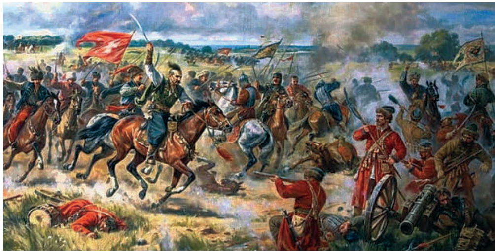
КОНОТОПСЬКА БИТВА – ТАК НАШІ ПРЕДКИ З БОЖОЮ ПОМІЧЧЮ НИЩИЛИ НОСІВ ЗЛА У ЯВІ

Антисвітотемною виставлялось прямою протилежністю добра (ДОБРО – ДО Брами Отців). Бо добро завжди стимулювало духовне кормління людини, ірійний