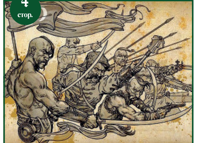
Боротися зі злом вчимося у предків