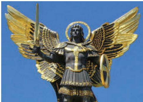
АРХАНГЕЛ МИХАІЛ – ПЕРШИЙ СЕРЕД ДУХІВ ГОСПОДНІХ В НЕБЕСНОМУ ВОЙНСТВІ

Предки знали – сформована антисвітотемна ява, є носієм зла (ЗЛО – Змія Личина Ощирена/оскалена), загрозою для всього світлого і людського, того, що збудоване на Законі Творця (ЗАКОН – ЗА Кормлінням Отця Небесного). Бо саме через темну яву, її нечистих духів в примарах, антисвітотемною здійснювались енергетичні крадіжки духовної енергії Творця.