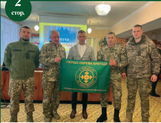
Кубок бригади Богуна здобули агроінженери