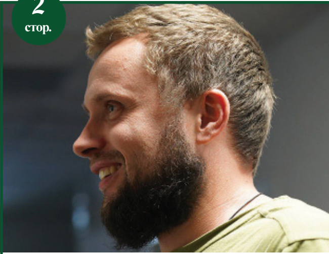
"Байрактар" нагороджений "За зразкову службу"