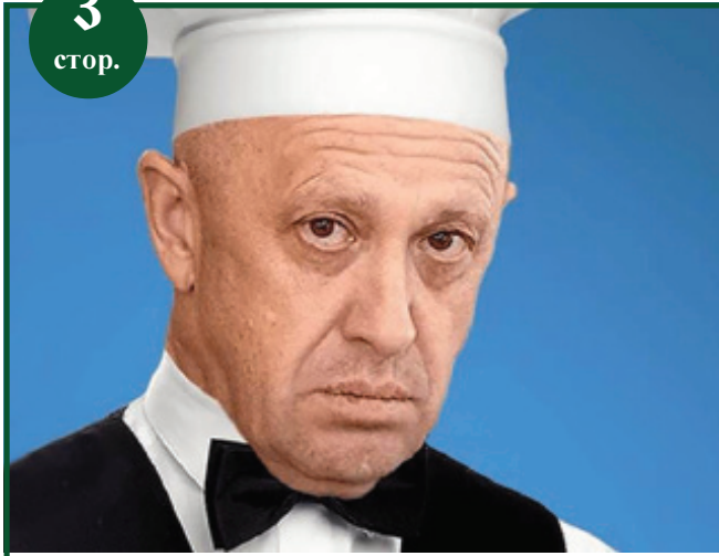
Справжню мету спецоперації росіянам назвав кухар