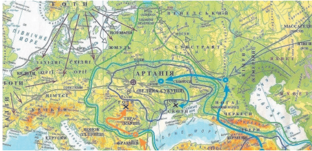
СЛОВ'ЯНСЬКИЙ ПРАВОСЛАВНИЙ ПРОСТІР У 6 СТ. ДО Н. Е. (ДОСЛІДНИЦЬКА КАРТА)

лібію) та формування особливого державного осередку на Волині – Роксолані .