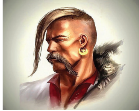
ХАРАКТЕРНИК З ОСЕЛЕДЦЕМ ТА СЕРЕЖКОЮ – СИМВОЛАМИ ДУХОВНОЇ ПОСВЯТИ

Його будівництво співпадає з кінцем процесу трансформації держави Артанії (Великої Сукупії) в Дулібський союз (Ду-