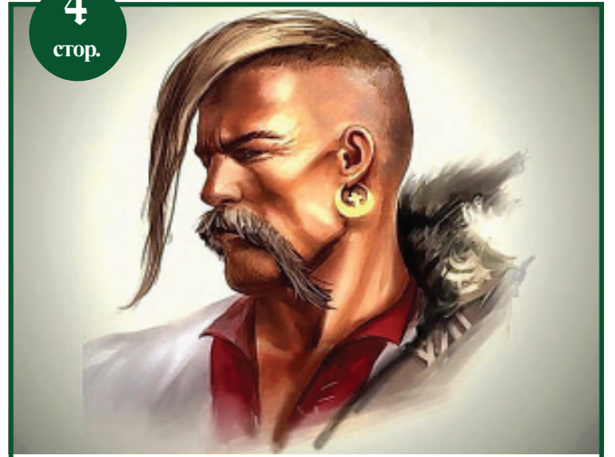
Що ми знаємо про українських характерників?