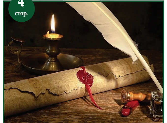
Як москалі нашу правду спотворювали