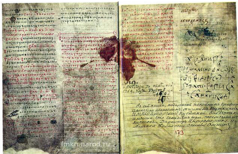
СТОРІНКИ ІПАТСЬКОГО ЛІТОПІСУ КОМПІЛЬОВАНОГО В МОСКОВІІ В 15-16 СТОЛІТТЯХ

На жаль в українській історії автентична джерельна база слов'янського та українського походження велика рідкість. Бо переважна більшість літописних матеріалів останніх тисячоліть або жорстоко понижені, або замінені на чужинські "джерела".