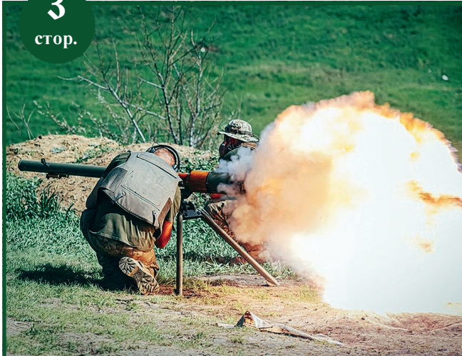
Дюжина знищеної техніки за добу лише під Авдіївкою