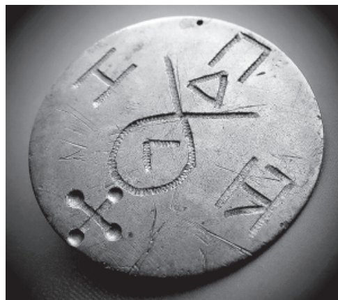
СТРУКТУРА СВІТЛОГО ІРІЮ – САКРАЛЬНЕ ВЕЛЕСОВИЧНЕ ЗОБРАЖЕННЯ ЧАСІВ ДУЛІБІЇ

Предкам було відомо: у світлих Мирах нашого Зодіаку, на всіх заселених планетах, цим займається Рахмано-волхвівська духовна система, яка здійснює просвітницьку діяльність та забезпечує зв'язок суспільства з керівною силою Всесвіту – Творцем та Правую.