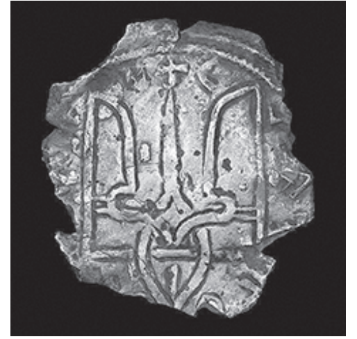
ТРИЗУБ – СИМВОЛ ТРОЯНІ, ТРИЄДИНОЇ РАХМАНСЬКОЇ ДУХОВНОЇ ВЛАДИ

спільство знизу до верху), де обраними учасниками віча були шановані представники родів, поселень, територій, князівств, які висувались і затверджувались на низових вічах.