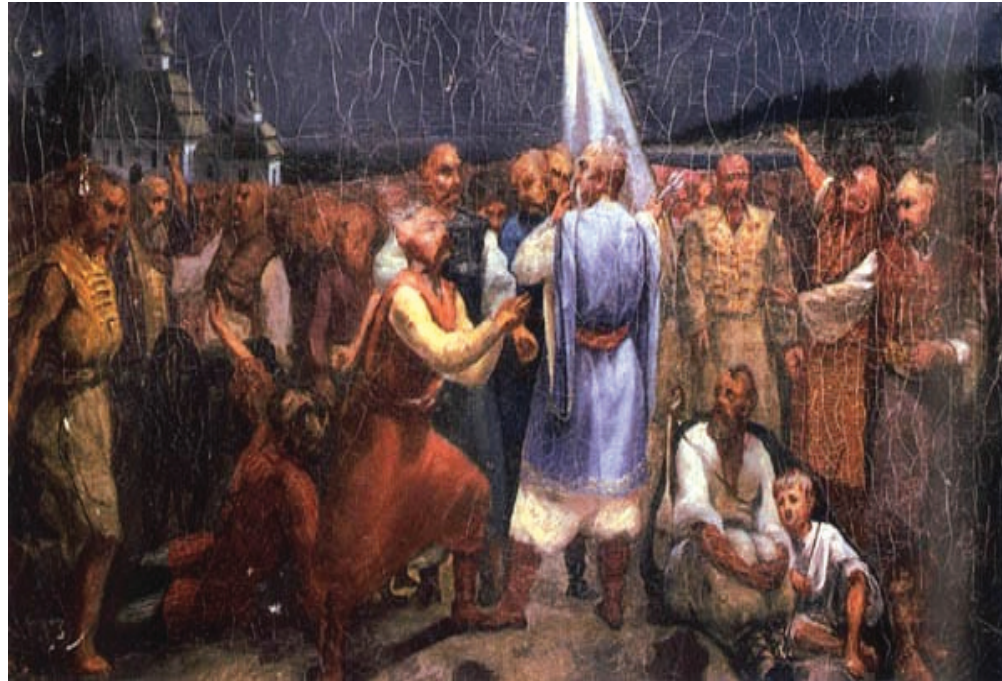
ОСТАННЯ РАДА НА СІЧІ – ПЕРЕДДЕНЬ ЛІКВІДАЦІЇ ВОРОГАМИ ВІЧОВОЇ СИСТЕМИ В УКРАЇНІ

Відірваний від цієї системи Мир, як то у випадку з Миром Землі, де у минулому мав місце акт агресії з боку антисвіту, поступово деградує, рухаючись до планетарної руйнації.