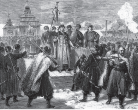
РАДА НА СІЧІ – ПРИКЛАД ШАНУВАННЯ СУСПІЛЬСТВОМ ЗАКОНІВ ПРАВИ (БОГА)

Згідно правил Прави явлені світлі Мири є тими місцями у Світлому Ірії де відбувається справжнє і принципово безпечне удосконалення явлених людських душ.