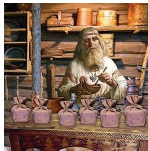
ПРАВОСЛАВНИЙ СВІТОГЛЯД ТА ЦІЛИТЕЛЬСТВО – ЛІКИ ВІД НЕЧИСТОГО В МИРІ ЗЕМЛІ

Рахманами та волхвами підбір лікувальних засобів відбувався за принципом відповідності їх енерго-польовим показникам (частота, амплітуда польових/духовних вібрацій) органів людини, її систем життєдіяльності.