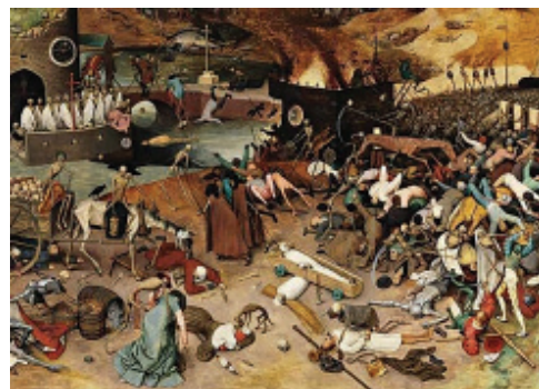
СЕРЕДНЬОВІЧНІ ЕПІДЕМІЇ – ПРОЯВ ТЕМНОГО І НЕЧИСТОГО В ПОЛЯХ МИРУ ЗЕМЛІ

Все буде нагадувати масштабні середньовічні епідемії (чуми, холери, інших хвороб). Передвісниками таких стануть прояви новітніх невиліковних хвороб, коли традиційні засоби боротьби з епідеміями виявляться слабкими, неефективними, безрезультатними.