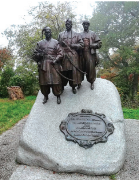
ПАМ'ЯТНИК СЛАВНИМ УКРАЇНСЬКИМ КОЗАКАМ У М. ВІДНІ, АВСТРІЯ

Для світлих душ рівнів Яви (до рівня +14), які вчиняють самопожертву, з відходом у бою за світоглядні цінності, за народ і землю, в Світлому Ірїї означено спеціальні ірїйні рівні. Це рівні Прави від +32 до +40, або рівні Славних Героїв . Такі рівні дозволяють душам героїв реанкернуватись (реінкернуватись) в новому швидкому явленні, яке може настати вже через 1-3 роки.