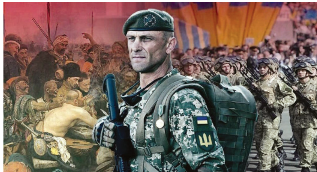
ЗВ'ЯЗОК СЛАВНОГО МИНУЛОГО І ГЕРОЇЧНОГО СЬОГОДЕННЯ МАЄ БУТИ НЕРОЗРИВНИМ!

– "ІВАН БОГУН: ТАЄМНИЦІ УКРАЇНСЬКОГО МИНУЛОГО".