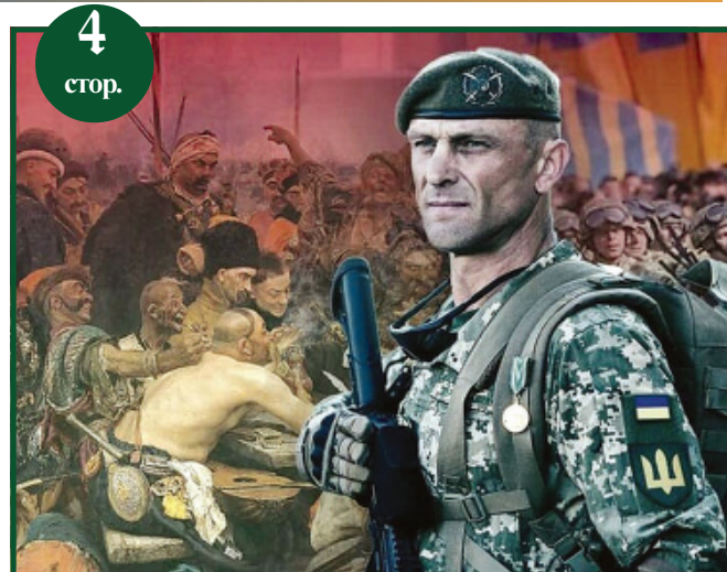
2 стор. Культурний десант" порадував і богунців