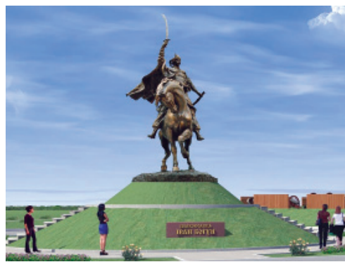
ПРОЕКТ ПАМ'ЯТНИКА ІВАНУ БОГУНУ НА ПОЛІ БЕРЕСТЕЦЬКОЇ БИТВИ В с. ПЛЯШЕВА

Православні предки знали – реанкернована (реінкернована) душа може з'явитись і у дуже віддалених осередках, у маловідомих генетичних родичів. Як правило це відбувається там де зачата дитина до якої Отці Роду направляють душу героя.