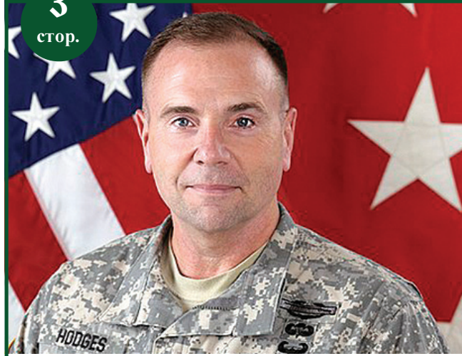
Нам дякують, а значить – у біді не залишать