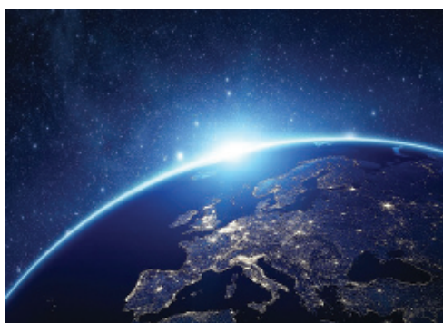
ВСЕСВІТ – МІСЦЕ БУТТЯ ВИСОКИХ ДУШ ЛЮДЕЙ, ДЕ ПЛАНЕТИ – МІСЦЯ ЇХ ТІЛЕСНОГО ЯВЛЕННЯ

Предки знали – неодноразове явлення високодуховної людини визначається двома чинниками: а) досягненням душею людини рівнів Прави; б) наявністю на планеті представників Роду людини, носіїв її особливого генетичного родового коду.