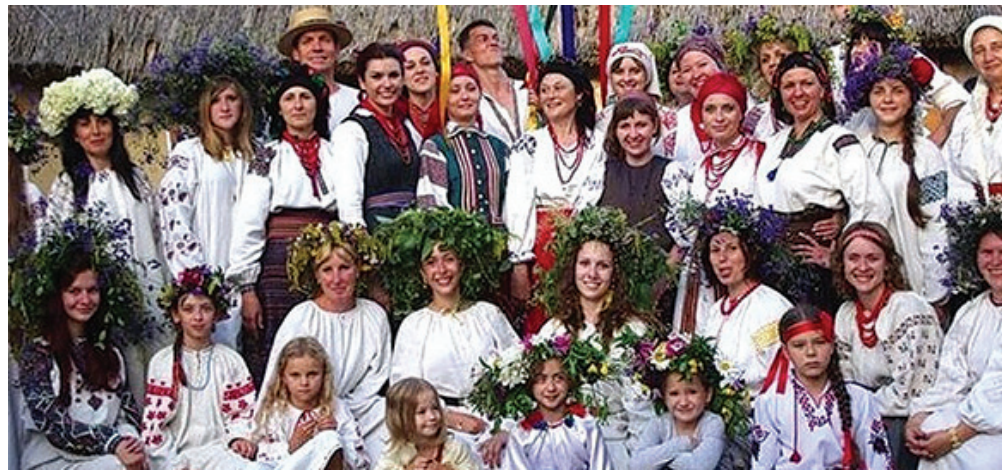
РІД – НОСІЙ ГЕНЕТИЧНОГО КОДУ ЛЮДИНИ В ЯВІ, ЯКИЙ ВІДПОВІДАЄ ЇЇ ДУХОВНОМУ НАЧАЛУ

РОД – це давня сакральна аббревіатура (Рівні Отців Дерева), яка означає структурованість Роду в Праві, засновником якого є Перший Отець Роду (Патріарх), який тримає Коло Отців Роду та творить Родовий Дух (програму Роду).