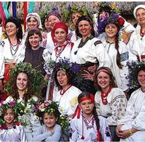
ми над душею дитини. Єство матері (особливо її душа, дух, атман) мали стати міцною духовною бронею для дитини.

Саме через це молодим матерям православні Отці минулого радили тримати стан Берегині – стан високої духовної опіки власними високими ірїйними рівнями