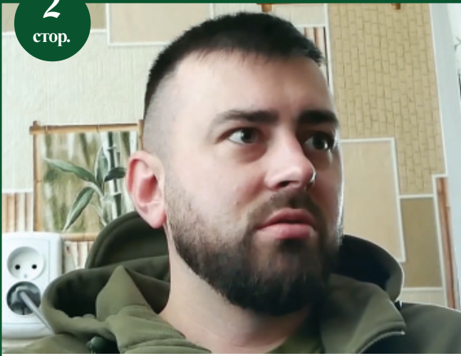
Броньований "кулак" Богунської бригади