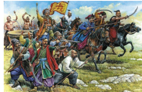
ЗАХИСТ ЛЮДСЬКОГО ТА ГЕНЕТИКИ РОДУ ЛЮДИНИ – ЗАПОРУКА НОВИХ ЇЇ ЯВЛЕНЬ В ЯВУ

Повторне явлення духовно високих особистостей в минулому Землі тривало всю історію планети. Численні православні Отці, Рахмани та Характерники, являлись в Мир Землі багато разів . Проте в нових явленнях у них не залишалось буденної пам'яті про попередні втілення.