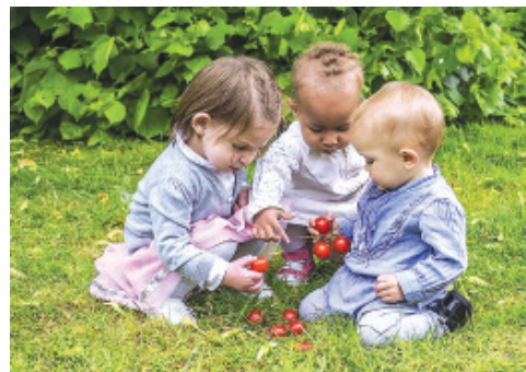
ПОТОМКИ – ЧАСТИНА ЯВЛЕННОГО РОДУ ЛЮДИНИ, НОСІЇ ОСОБЛИВОЇ ГЕНЕТИКИ РОДУ

Також варто нагадати: у давньому православному світогляді смислом явленого життя людини означено – духовне удосконалення людини, її ірїйний ріст, служіння Праві.