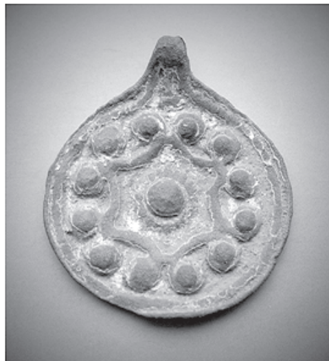
СЛОВ'ЯНСЬКИЙ ПРАВОСЛАВНИЙ ОБЕРГ: 12-ТИ ЕЛЕМЕНТНИЙ СИМВОЛ МАЛОГО ЗОДІАКУ