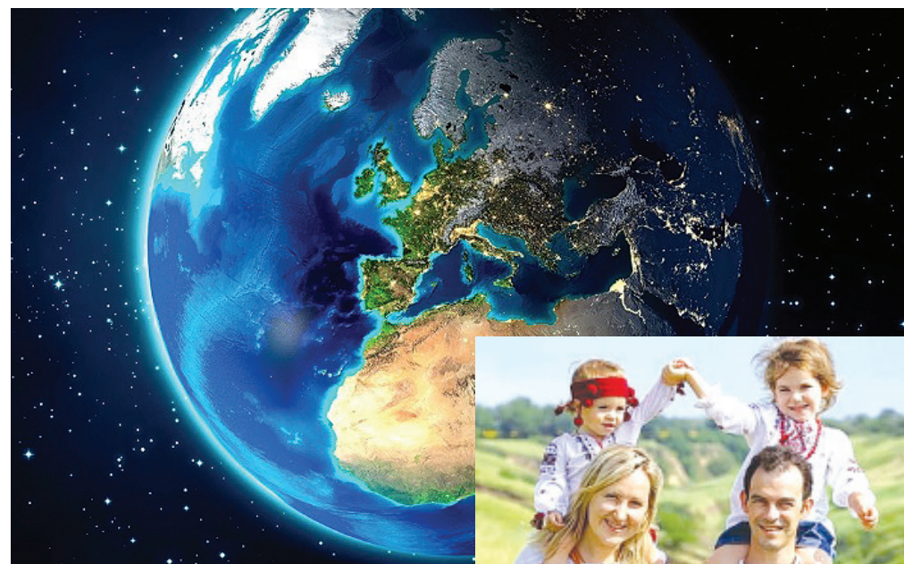
ПЛАНЕТА ЗЕМЛЯ – МІСЦЕ ВИРІШАЛЬНОЇ БИТВИ ЗА ВСЕЛЕНСЬКЕ ЖИТТЯ

Черговою, шостою ціллю Антихреста став Мир планети Земля, молодий і не сформований остаточно, у якому розгорнулася боротьба, яку називаємо війною між добром і злом, між Світлим Ірієм та антисвітом!