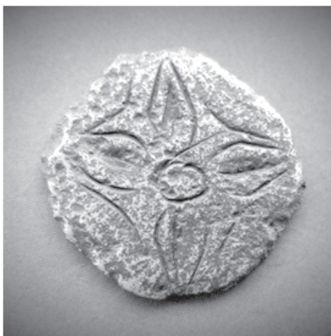
СЛОВ'ЯНСЬКЕ ЗОБРАЖЕННЯ ВСЕСВІТУ – ЧОТИРИ СВІТИ ЯВЛЕНІ ЯК МАЛІ ЗОДІАКИ