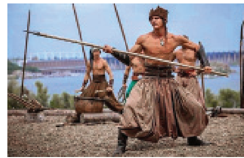
РАХМАНИ ЗНАЛИ: ВОЛЬОВА ЛЮДИНА – ДУХОВНО НЕВРАЗЛИВА ДЛЯ НЕЛЮДСЬКОГО ТА ТЕМНОГО

У наслідок цього було зупинено процес православного просвітництва – основи українського вольнолюбства та величі українського духу.