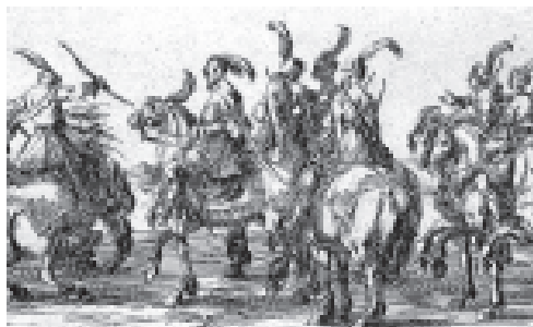
УКРАЇНЬСЬКА ШЛЯХТА – ДУХОВНО ПАДШЕ ПРАВОСЛАВНЕ СТАРШИНСТВО

Наші предки, носії давнього православного світогляду, Отці Рахмани та Характерники, знали, що руйнуючою силою духовної стійкості та міцного польового зв'язку з Родом та Правую (такий зветься свідомістю), є духовне падіння – втрата ємності полів душі, розмивання основ свідомості, пониження ірійних рівнів, наближення душі до Брами світлого людства, з перспективою падіння за неї, і як результат завершення буття душі (дивись схему Світлого Ірїю у статті "ДУХОВНІ ПРОВІДНИКИ ВСЕЛЕНСЬКОГО ЛЮДСТВА").