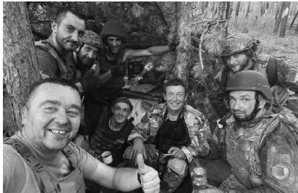
НА ПОЗИЦІЯХ В СЕРЕБРЯНСЬКОМУ ЛІСІ. ЛИПЕНЬ 2023 РОКУ