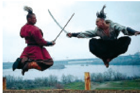
ВИХОВАННЯ ВОЛІ ЧЕРЕЗ УДОСКОНАЛЕННЯ – ЗАПОРУКА ДУХОВНОЇ СТИЙКОСТІ ЛЮДИНИ

В таких умовах увага людини поступово концентрується на егоїстичному , на негативних емоціях, на приземлених мирських переживаннях, які відкидають праведне та Боже.