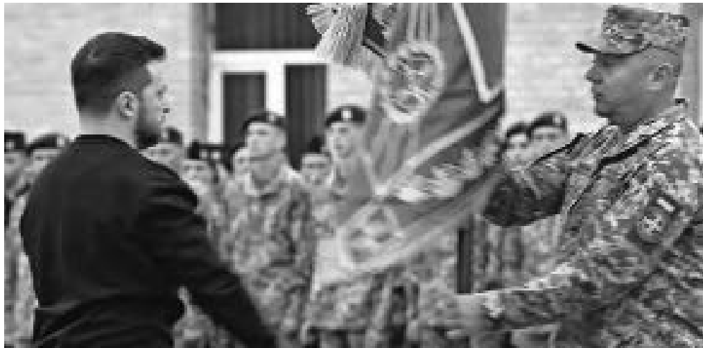
ПРЕЗИДЕНТ УКРАЇНИ ВОЛОДИМИР ЗЕЛЕНСЬКИЙ ВРУЧАЄ БОЙОВИЙ ПРАПОР КОМАНДИРУ 1-ї ОКРЕМОЇ БРИГАДИ СПЕЦІАЛЬНОГО ПРИЗНАЧЕННЯ ІМ. ІВАНА БОГУНА ПОЛКОВНИКУ ОЛЕГУ УМІНСЬКОМУ

У минулому виході газети "Братство Богуна" ми повідомляли про те, що 1 жовтня 2023-го року Перша окрема бригада спеціального призначення ім. Івана Богуна отримала свій бойовий прапор. В урочистій обстановці відзначення Дня захисників і захисниць України, на території Національного історико – архітектурного музею "Київська фортеця" командир бригади полковнику Олегу Умінському бойове знамено вручив Президент України Володимир Зеленський.